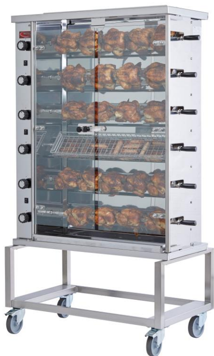
ITD26A + ITPD

Utilisation : Intérieur / extérieur (Endroit abrité)