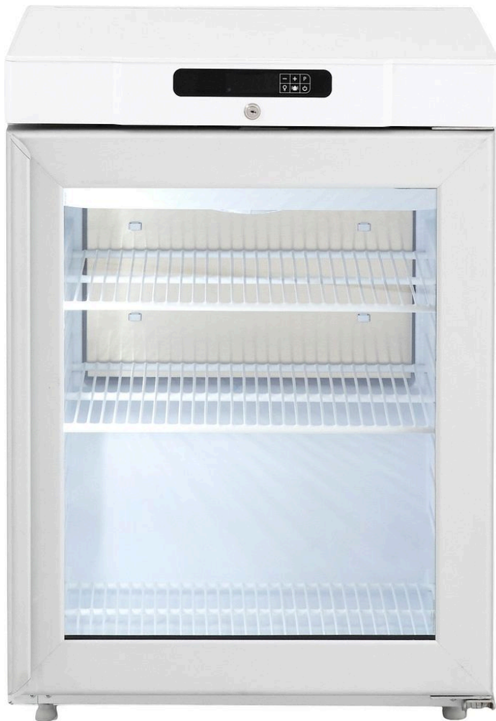
TABLE TOP POSITIF BLANC VITRE 125 L