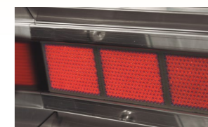
Quemador gas Brûleur à gaz Gas burner