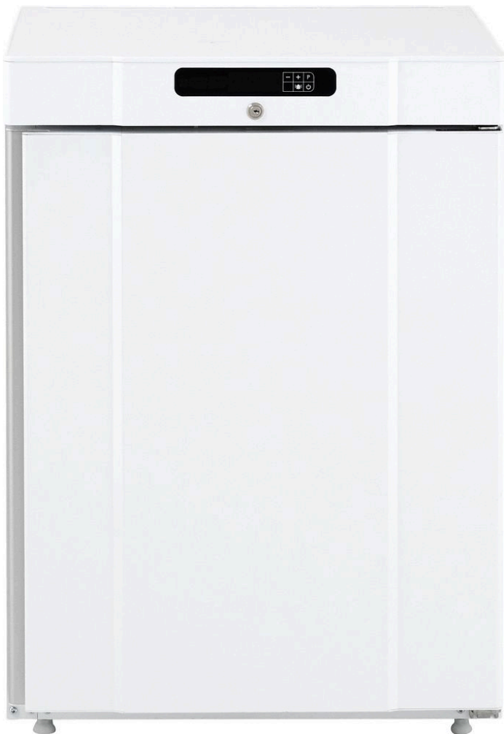
TABLE TOP POSITIF BLANC 125 L