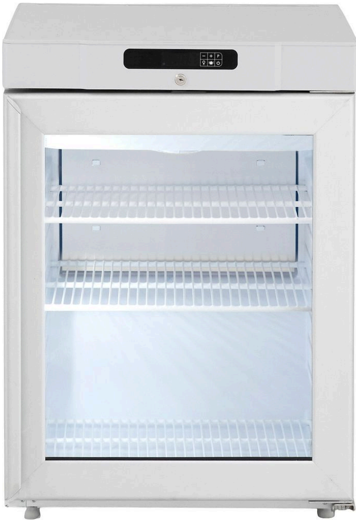
TABLE TOP POSITIF INOX VITREE 125 L