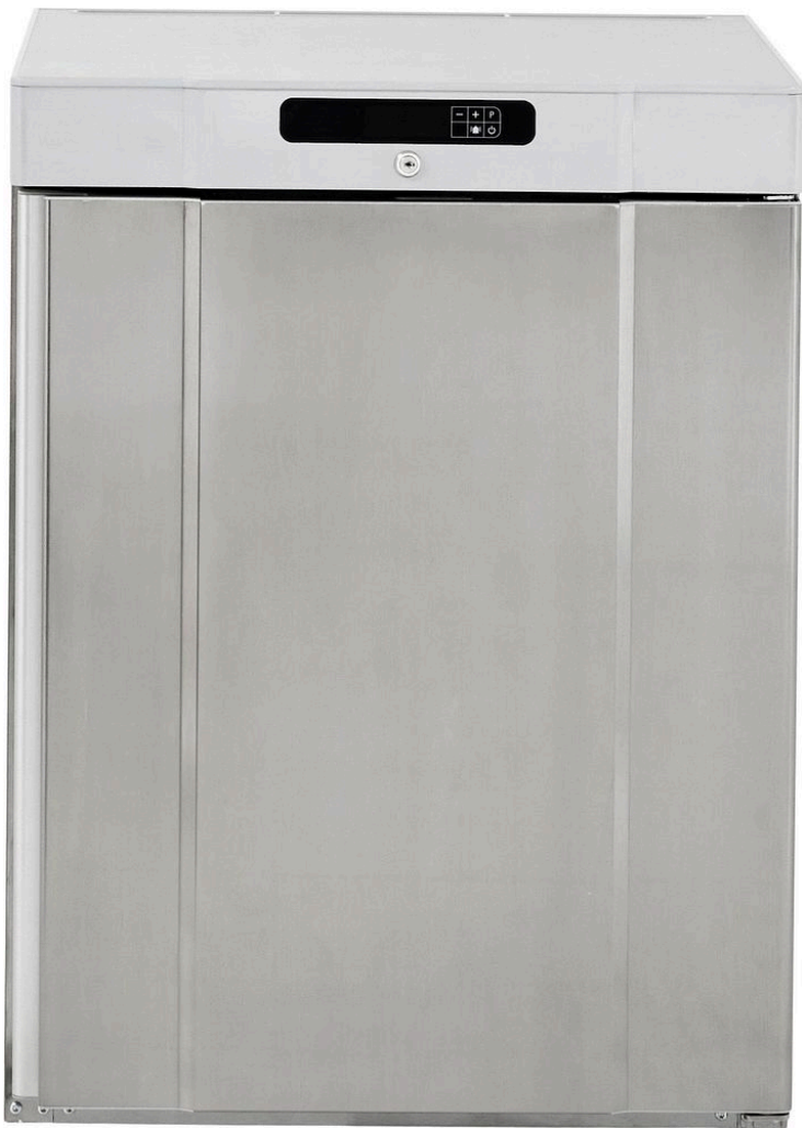
TABLE TOP POSITIF INOX 125 L